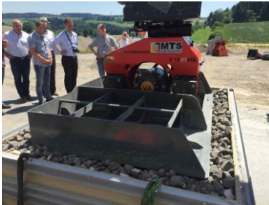
erste Verdichtung mit 1,2 : 1