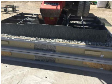
zweite Verdichtung mit 1,3 : 1