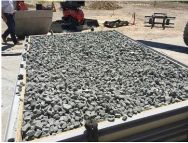
erste Verdichtung mit 1,3 : 1